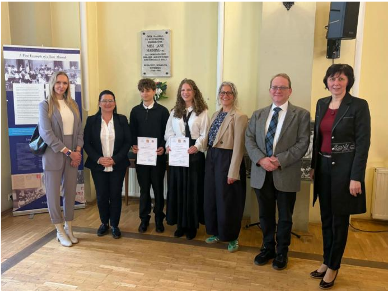
A Református iskolák 8. és 10. évfolyamos versenyének győztesei, a fő- és további díjak felajánlóinak képviselői, a Református Skót Misszió lelkésze, az RPI igazgatója és munkatársa