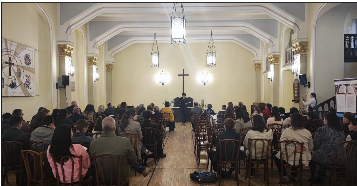
A verseny megnyitója