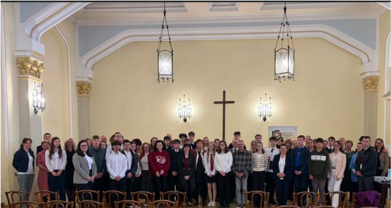
A verseny református kategóriájának résztvevői