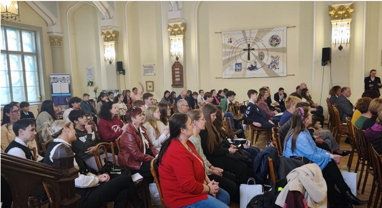
A verseny református kategóriájának résztvevői