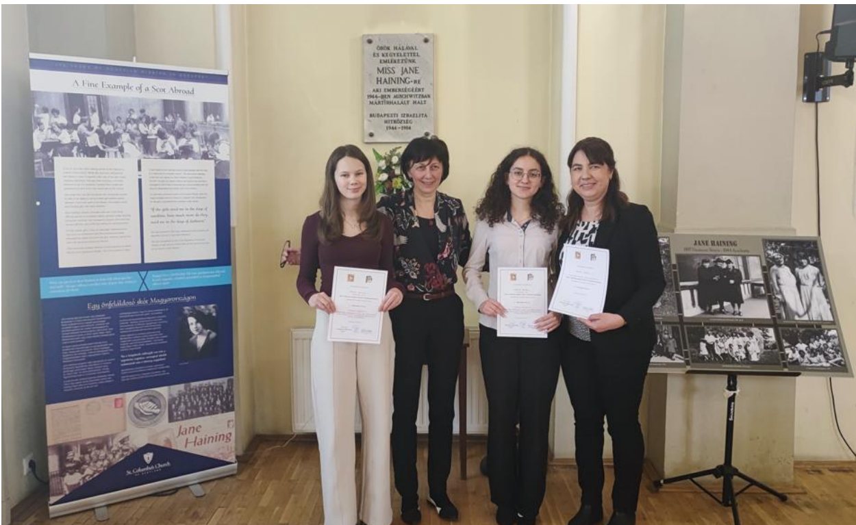
A budapesti iskolák 8. és 10. évfolyamos versenyének győztesei és egyikük felkészítőtanára