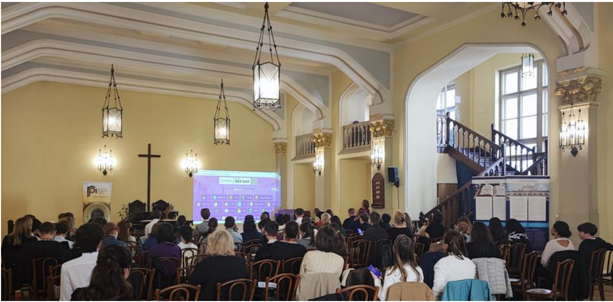
Kahoot quiz Skóciáról