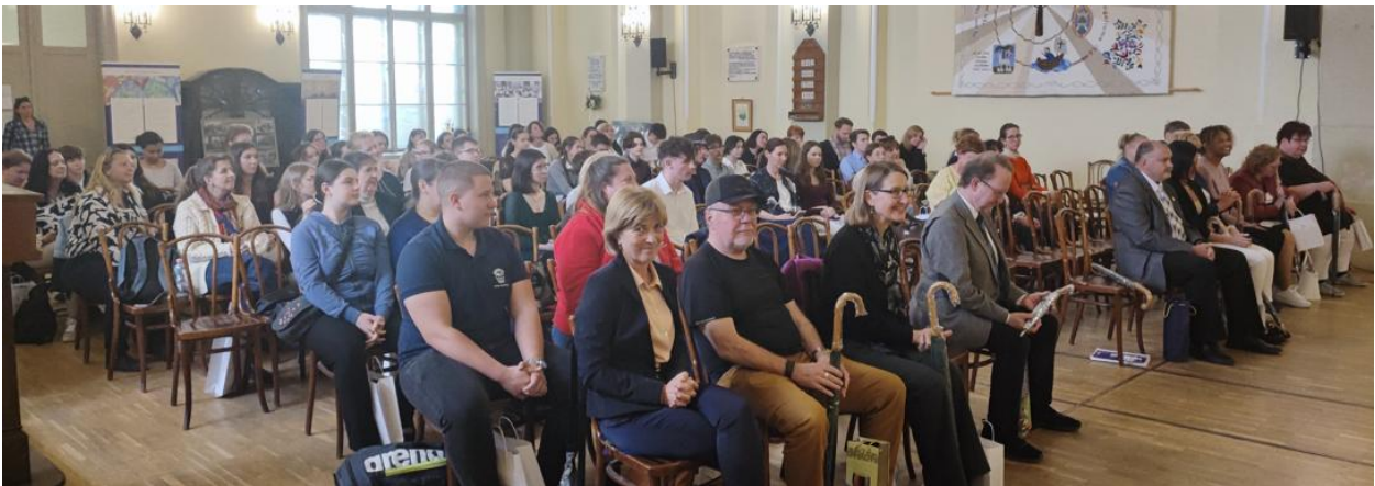
A verseny budapesti kategóriájának résztvevői